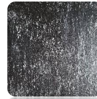
Black Venezia (BKv)

*) Dostępne kolory PREMIUM grzejnika WOMAN (struktura kamienia łupanego).