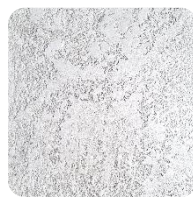
Opal White (WhO)