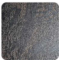
Opal Brown (BrO)