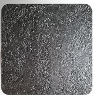
Opal Black (BkO)

*) Dostępne kolory PREMIUM grzejnika WOMAN (struktura kamienia łupanego).