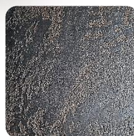
Opal Brown (BrO)