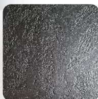
Opal Black (BkO)

*)Dostępne kolory PREMIUM grzejnika TOR (struktura kamienia łupanego).