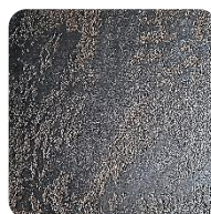
Opal Brown (BrO)