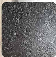
Opal Black (BkO)

*)Dostępne kolory PREMIUM grzejnika ONE (struktura kamienia łupanego).