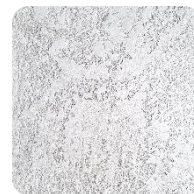
Opal White (WhO)