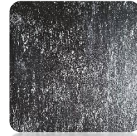
Black Venezia (BKv)

*)Dostępne kolory PREMIUM grzejnika ONE (struktura kamienia łupanego).