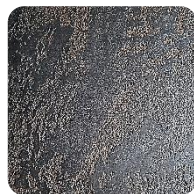
Opal Brown (BrO)