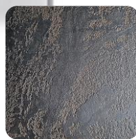
Opal Brown (BrO)