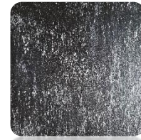
Black Venezia (BKv)

*) Dostępne kolory PREMIUM grzejnika INFINITI (struktura kamienia łupanego).