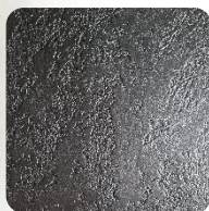
Opal Black (BkO)

*)Dostępne kolory PREMIUM grzejnika COSMO (struktura kamienia łupanego).