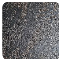
Opal Brown (BrO)