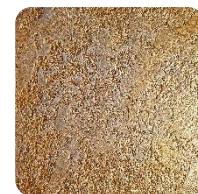
Opal Gold (GdO)

Moc cieplna grzejników wodnych wyrażona w watach, jest mierzona zgodnie z normą EN 442-2. Temperatura zasilania wynosi 75°C, temperatura powrotna 65°C, a temperatura otoczenia 20°C.