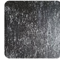
Black Venezia (BKv)

*)Dostępne kolory PREMIUM grzejnika COSMO (struktura kamienia łupanego).